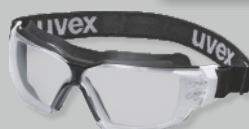
UVEX CX2 SONIC - EN 166 Réf.: 9309.275