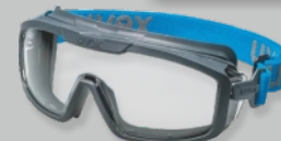
UVEX I-GUARD+ - EN 166 | EN 170 Réf.: 9143.267