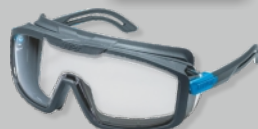
UVEX I-GUARD - EN 166 Réf.: 9143.266