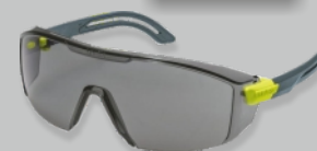
UVEX I-lite - EN 166 Réf.: 9143.281