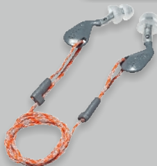
Bouchons X-ACT-FIT - EN 352-2 SNR 26 dB - Bouchons d'oreilles réutilisables Réf.: 2124.017