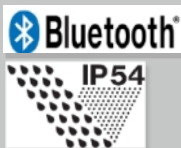
Coquilles AXESS ONE - SNR 31 dB - Connexion Bluetooth (téléphone, radio,...) Réf.: 2640.001