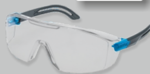
UVEX I-lite - EN 166 Réf.: 9143.265