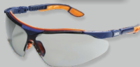
UVEX I-VO - EN 166 Réf.: 9160.265