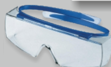
UVEX SUPER OTG - EN 166 Réf.: 9169.260