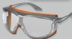
UVEX SKYGUARD NT - EN 166 Réf.: 9175-275