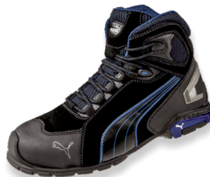
RIO BLACK MID 632250 Tailles: 39 à 47 EN 20345 S3L SRC