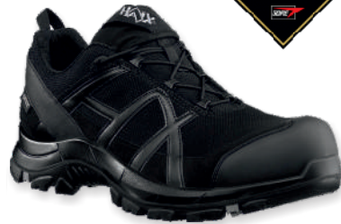
Black Eagle Safety 40.1 low Black-Black Nr.: 610010 Tailles: 36 à 50 (3½ - 14 UK) CE EN ISO 20345:2011 S3 HRO HI CI WR SRC