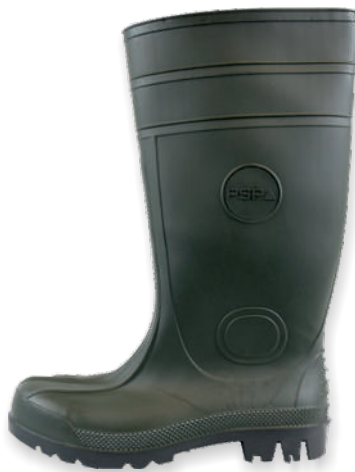
Bottes vertes PVC/NITRILE 35377 Tailles: 39 à 48 EN 20345 S5