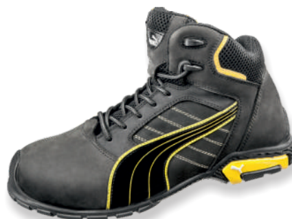
AMSTERDAM MID 632240 Tailles: 39 à 47 EN 20345 S3L SRC