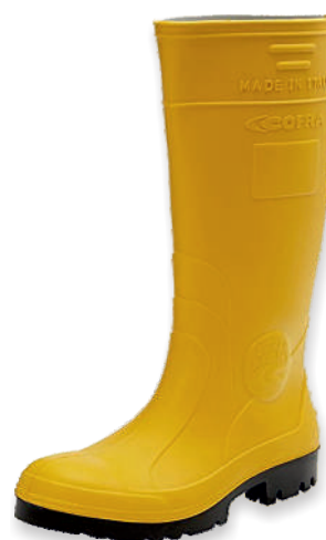
Bottes jaunes PU 35385 Tailles: 37 à 48 EN 20345 S5