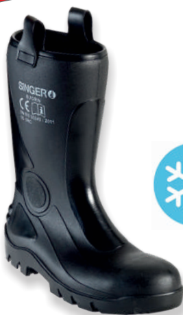
Bottes BORN BORN Tailles: 39 à 47 EN 20345 S5 SRC