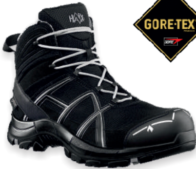
Black Eagle Safety 40.1 mid Black-Silver Nr.: 610019 Tailles: 38 à 48 (5 - 12½ UK) CE EN ISO 20345:2011 S3 HRO HI CI WR SRC