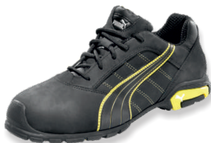
AMSTERDAM LOW 642710 Tailles: 39 à 47 EN 20345 S3L SRC