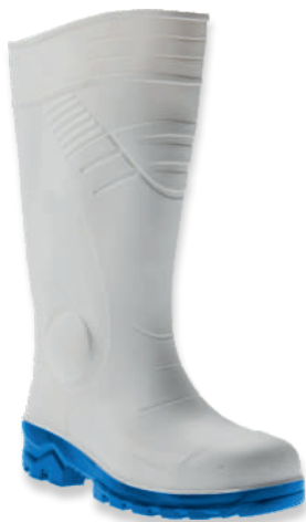
Bottes blanches PVC/NITRILE OMEGA Tailles: 36 à 48 EN 20345 S4 SRC