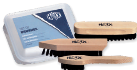
Set de brosses 900300