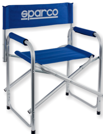
Chaise pliable SPARCO PADDOCK