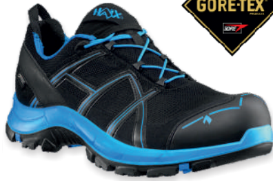
Black Eagle Safety 40.1 low Black-Blue Nr.: 610001 Tailles: 38 à 48 (5 - 12½ UK) CE EN ISO 20345:2011 S3 HRO HI CI WR SRC