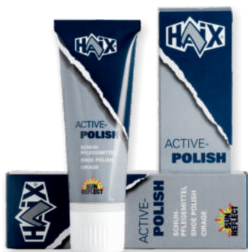
Tubes de cirage 900060 noir 75 ml 900080 incolore 75 ml