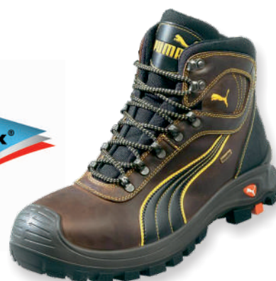
SIERRA NEVADA MID 630220 Tailles: 36 à 48 EN 20345 S3 WR HRO SRC