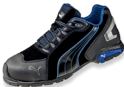
RIO BLACK LOW 642750 Tailles: 39 à 47 EN 20345 S3L SRC