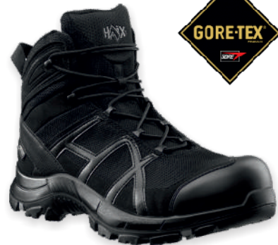
Black Eagle Safety 40.1 mid Black-Black Nr.: 610024 Tailles: 39 à 47 (5½ - 12 UK) CE EN ISO 20345:2011 S3 HRO HI CI WR SRC