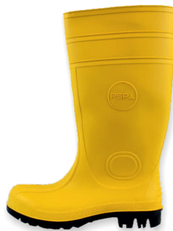
Bottes jaunes PVC/NITRILE 30-200 Tailles: 39 à 48 EN 20345 S5