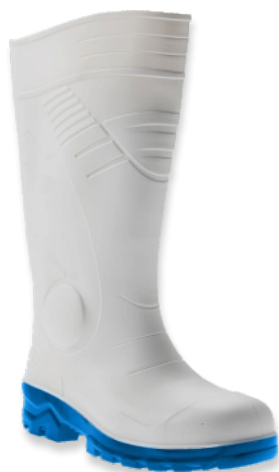
Bottes blanches PVC/NITRILE OMEGA Tailles: 36 à 48 EN 20345 S5