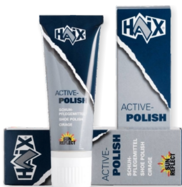
Tubes de cirage 900060 noir 75 ml 900080 incolore 75 ml