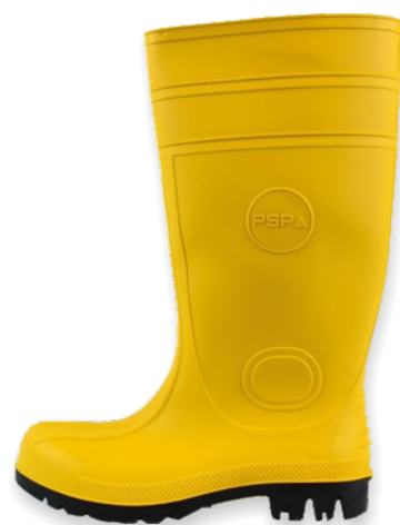
Bottes jaunes PVC/NITRILE 30-200 Tailles: 39 à 48 EN 20345 S5