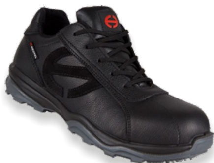
RUN-R 400 LOW RUNR400-B Tailles: 37 à 48 EN 20345 S3 SRC