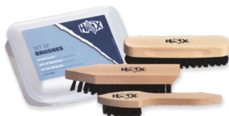
Set de brosses 900300