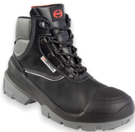
ALPHA Tailles: 38 à 48 EN 345 S3 CI