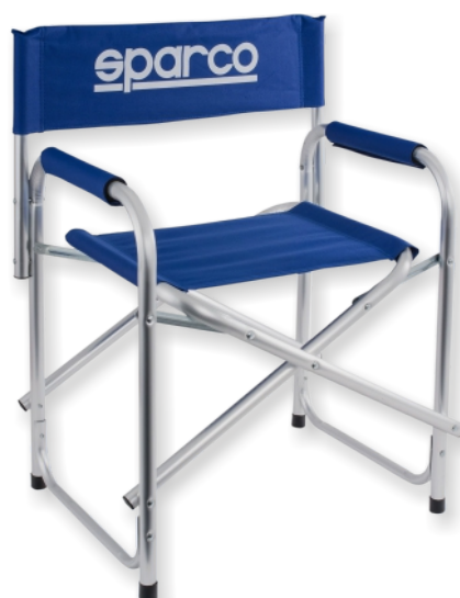
Chaise pliable SPARCO PADDOCK