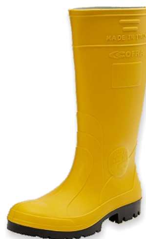
Bottes jaunes PU 35385 Tailles: 37 à 48 EN 20345 S5