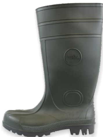
Bottes vertes PVC/NITRILE 35377 Tailles: 39 à 48 EN 20345 S5