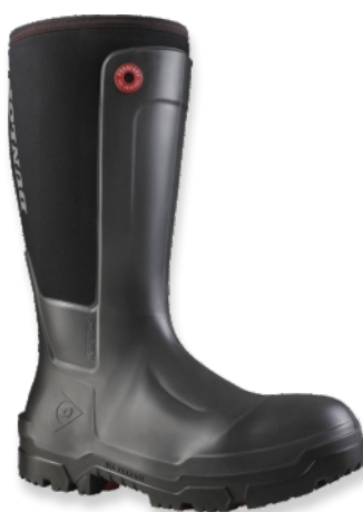
Bottes DUNLOP SNUGBOOT WORKPRO 5.30.280 Tailles: 38 à 48 EN 20345 S5 CI CR SRC