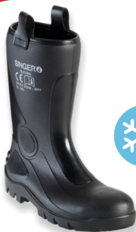
Bottes BJORN BJORN Tailles: 39 à 47 EN 20345 S5 SRC