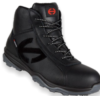
RUN-R 400 HIGH RUNR400-H Tailles: 37 à 48 EN 20345 S3 SRC