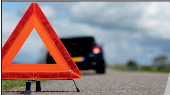
TRIANGLE DE SIGNALISATION

Valable jusqu'au 31.10.2020, sous réserve d'épuisement de stock.