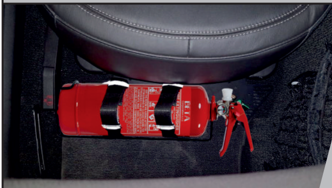
EXTINCTEUR À POUDRE