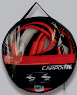
CÂBLES DE DÉMARRAGE