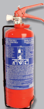
EXTINCTEUR À POUDRE