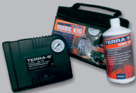
KIT ANTI CREVAISON