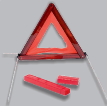
TRIANGLE DE SIGNALISATION