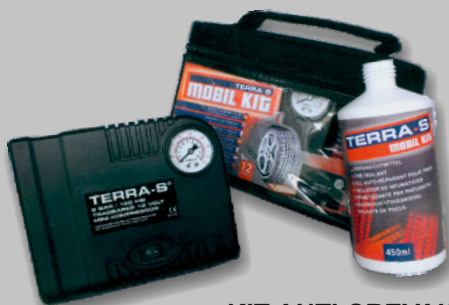
KIT ANTI CREVAISON