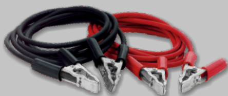
CABLES DE BATTERIE