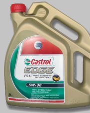
Bidon huile moteur CASTROL