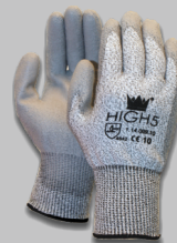
Gants HIGH 5 MAJESTIC