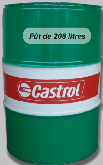
Fût de 208 litres

1250,40 € NET + TVA 1462,50 € TTC Réf.: EDGE5W30LL208* EDGE5W30208LC3**