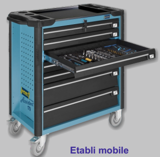
Etabli mobile HAZET