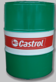
Fût huile moteur CASTROL