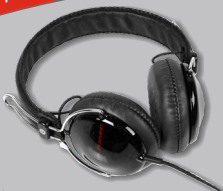
CASQUE AUDIO PIONEER SE-MJ151

OFFERT À L'ACHAT DE 60 LITRES (BIDONS 1 ET/OU 5 LITRES)