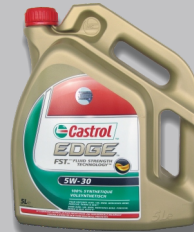
Bidon de 5 litres

9,40 € NET + TVA 11,00 € TTC Réf.: EDGE5W30LL1* EDGE5W301LC3**