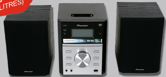
CHAÎNE MICRO PIONEER X-EM21

OFFERT À L'ACHAT DE 120 LITRES (BIDONS 1 ET/OU 5 LITRES)