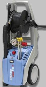
Nettoyeur haute pression KLANZLE