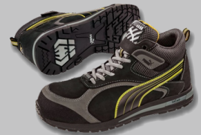
Chaussures FLARE MID PUMA