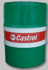
Fût huile moteur CASTROL