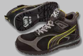
Chaussures FLARE MID PUMA