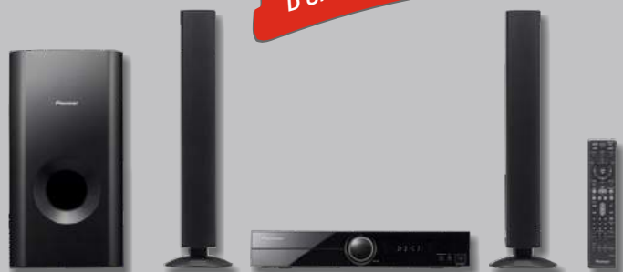
ENSEMBLE HOME-CINÉMA PIONEER DCS-FS313