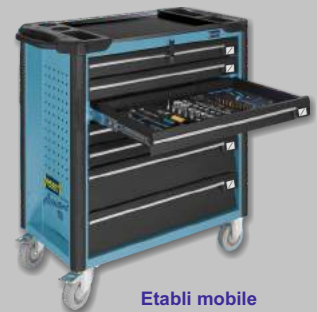
Etabli mobile HAZET