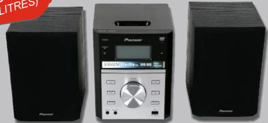
CHAÎNE MICRO PIONEER X-EM21

OFFERT À L'ACHAT DE 120 LITRES (BIDONS 1 ET/OU 5 LITRES)