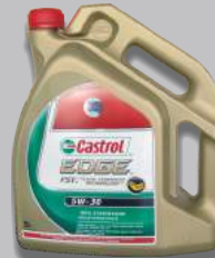
Bidon de 5 litres

9,40 € NET + TVA 11,00 € TTC Ref.: EDGE5W30LL1L* EDGE5W301LC3**