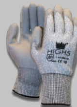
Gants HIGH 5 MAJESTIC