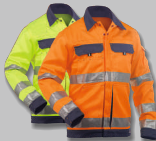
Veste DUSSELDORF DASSY