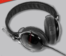
CASQUE AUDIO PIONEER SE-MJ151

OFFERT À L'ACHAT DE 60 LITRES (BIDONS 1 ET/OU 5 LITRES)