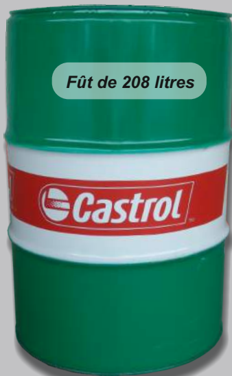
Fût de 208 litres

1250,40 € NET + TVA 1462,50 € TTC Ref.: EDGE5W30LL208* EDGE5W30208LC3**