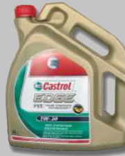
Bidon huile moteur CASTROL