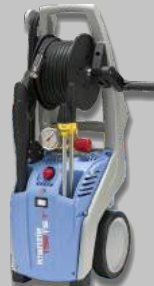
Nettoyeur haute pression KRANZLE